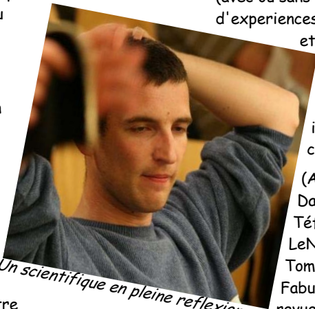
Un scientifique en pleine réflexion

Cette année encore, la JUMP a envoyé une équipe d'explorateurs de l'impossible, au tournoi international d'Eindhoven (Pays-Bas) afin d'y mener des expériences scientifiques inédites. Leurs principales missions étaient de définir la corrélation entre performances pongistiques et taux alcoolémie, de vérifier l'impact sur le niveau de jeu de produits réputés de la