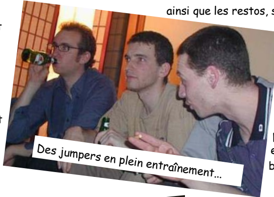
Des jumpers en plein entraînement...

La convivialité de la JUMP ne se dément pas. Les célèbres tournois de Noël et de fin d'année sont autant d'occasions de se retrouver autour d'un verre et d'une part de quiche. Les soirées d'après-matches,