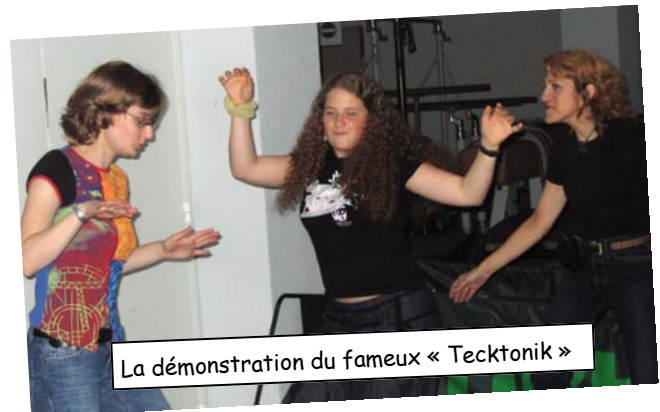
La démonstration du fameux « Tecktonik »