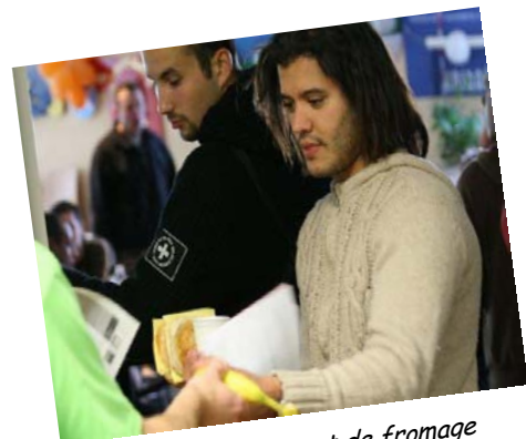
Le ravitaillement de fromage

signaler qu'elle reservait déjà les pages centrales de sa prochaine édition pour les résultats de ces travaux !