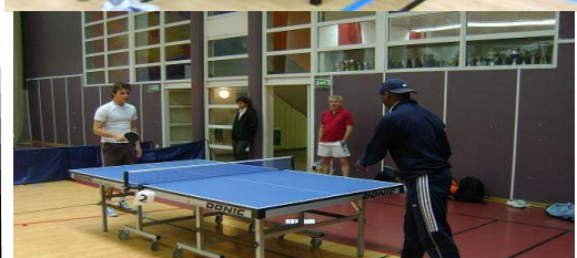
Des papas qui s'y mettent...les enfants tournez la tête ailleurs svp!