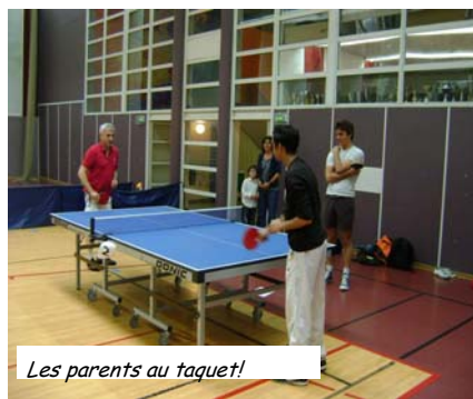
Les parents au taquet!