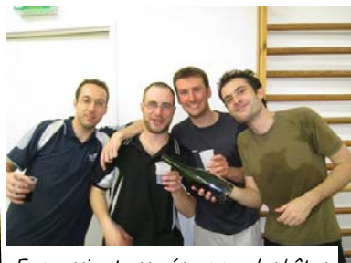
Eux aussi ont assurés comme des bêtes, mais pas dans la même catégorie!

Chez les juniors, c'est Qiangsheng qui fait péter le score (meilleure progression de la JUMP).