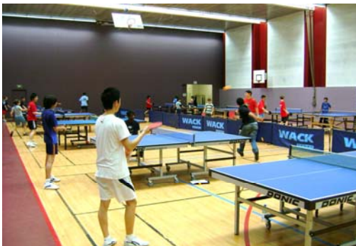
Les jeunes squattent, les parents doivent vont être obliger de sévir pour avoir de la place!