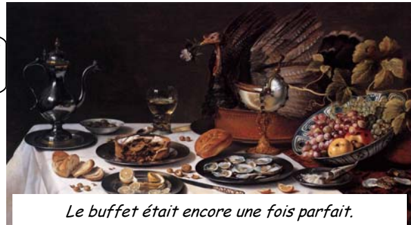
Le buffet était encore une fois parfait.

Parmi le top 7, du tableau 10-20, une erreur s'est glissée. Saurez-vous la retrouver ?