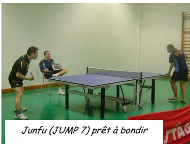
Junfu (JUMP 7) prêt à bondir

Chez les masculins, en D3, la JUMP 14 s'est bien amusée. En D2, les équipes font un bon parcours en finissant en milieu de tableau, mais deux d'entre elles descendent en D3 du fait de la descente de D1 des JUMP 9 et 10 (malgré les bonnes perfs des jeunes Léo, Jérôme, Nestor).