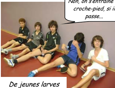
De jeunes larves