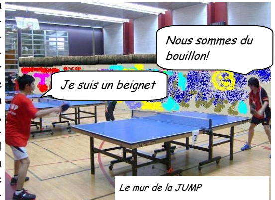
Le mur de la JUMP

Mais déjà les ingénieurs présents réfléchissent à la 2eme génération du mur, plus imperméable. Il s'agit d'une ligne infranchissable avec