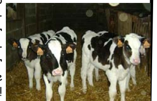
Les génisses de la JUMP attendent impatiemment le début des matchs.

* Il a été coupé avant de chanter la partie sur ce que fait Paulo aux génisses et aux taureaux. Ça devenait limite, non mais!