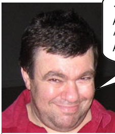
Une sommité locale

Un mois avant le salon de l'agriculture, samedi 30 et dimanche 31 janvier se disputera le challenge Bernard Jeu. "C'est quoi ?" vous me direz. Eh bien, le Bernard Jeu, c'est le rendez-vous le plus important pour tout club de ping. En effet, c'est une sorte de tournoi où les clubs s'affrontent dans les différentes catégories d'âge, de benjamin charolais à senior salers, en étalon masculin comme en féminine euh... Il est primordial d'être représenté partout, puis d'essayer de finir placé dans chaque catégorie. C'est donc un bon indicateur pour évaluer le niveau d'un club, sa formation et la qualité de son effectif.