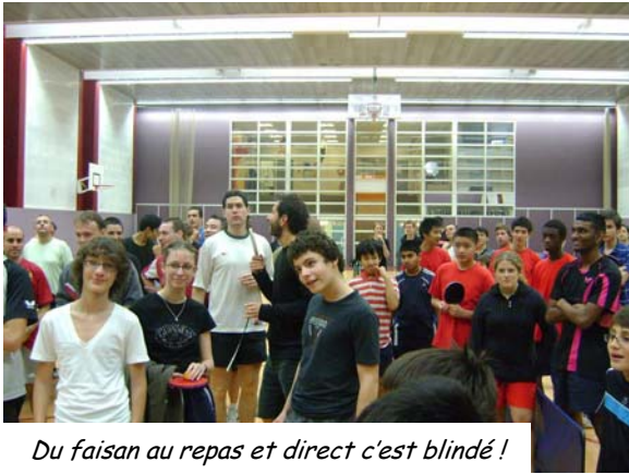
Du faisant au repas et direct c'est blindé !

On était encore nombreux (plus de 100 participants !) à se