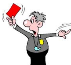
La ligue IDF donne un carton à la JUMP