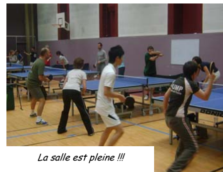
La salle est pleine !!!