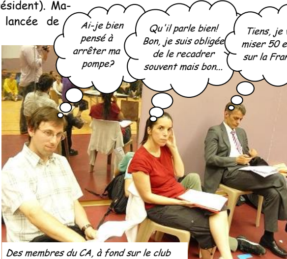
Des membres du CA, à fond sur le club