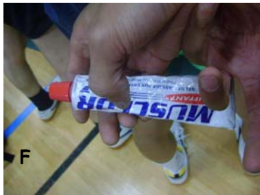
F Qui est Musclor?