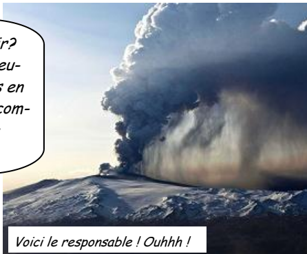
Voici le responsable ! Ouhhh !

On ne voulait pas descendre. Et puis ce pddjfkdhfkj de volcan islandais est