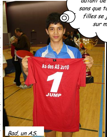
Bad, un AS.