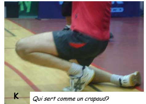
K Qui sert comme un crapaud?