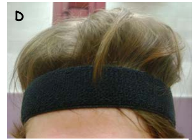
D Qui a un kougloff sur la tête?