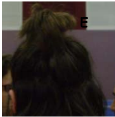
E Qui a un palmier sur la tête?