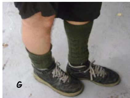
G Qui a le moral dans les chaussettes?