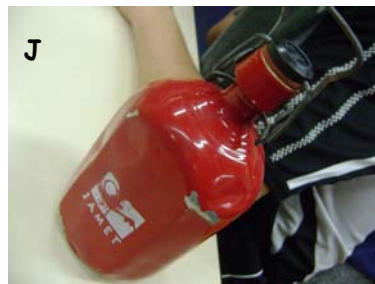
J Qui boit rouge?