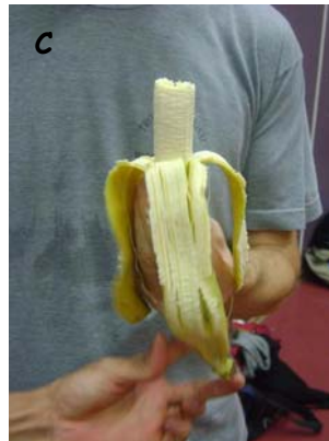
C Qui a la banane?