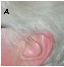
A Qui est cette oreille?

Jumpzema' s'occupe de vous, même l'été. Afin de ne pas trop s'ennuyer sur les plages, voici un quizz ludique pour évaluer votre connaissance en JUMPERS. Envoyez votre réponse à l'adresse suivante: Chuitropfortenjumper, PO BOX 730 , Roquefort la Bédoule Cedex 370 pour tenter de gagner un autographe de Raymond Domenech.