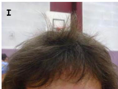
I Qui a ces cheveux?