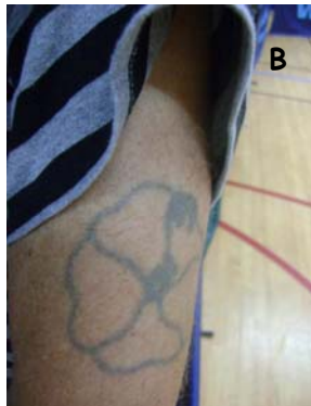
B Qui était bourré quand il s'est fait tatoué?