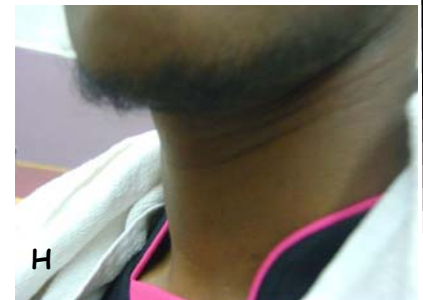
H Qui ne pense plus aux présidentielles régulièrement?