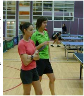
Nous pouvons constater que les féminines font semblant d'écouter les consignes de manière plus efficace que les hommes.

Bienvenue au téméraires féminines du mercredi !