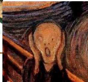
Le cri d'Eric Zemmour une fois informé