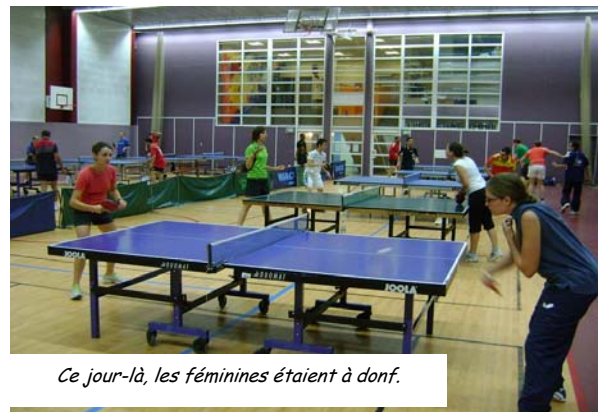
Ce jour-là, les féminines étaient à donf.

* A propos de l'entraînement du mercredi