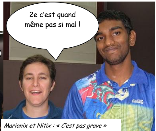
Marionix et Nitix : « C'est pas grave »

aime chanter des discours ("gauloises, gaulois, descendez dans la rue ! Trop, c'est trop ! Vous reprendrez bien un peu de sanglier ?"), fut bâillonné pour l'occasion !