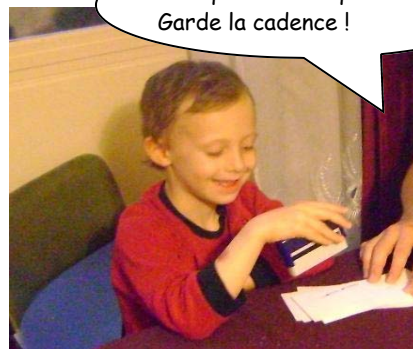
Les enfants c'est bien pratique : ça fait de la main d'œuvre corvéable à merci, notamment pour tamponner les chèques des adhérents pendant que le trésorier sirote son mojito.

Plus que 500 chèques !!! Garde la cadence !