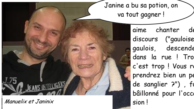
Manuelix et Janinix

Même au départ, une majorité, qui fit craindre à Sophix et Marix, les organisa-