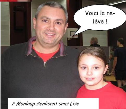
2 Monloup s'enlissent sans Lise