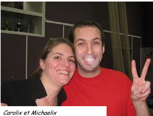
Carolix et Michaelix

Notre village d'irréductibles Jumpers a renouvelé son tournoi doublemix. Cette fois, il ne souffrait d'aucune équivoque :