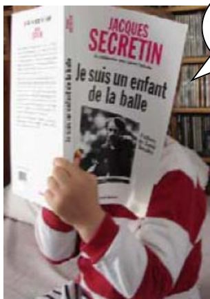
Les nouvelles histoires du père Raptor racontées dès le plus jeune âge