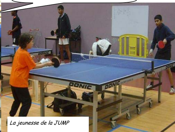
La jeunesse de la JUMP