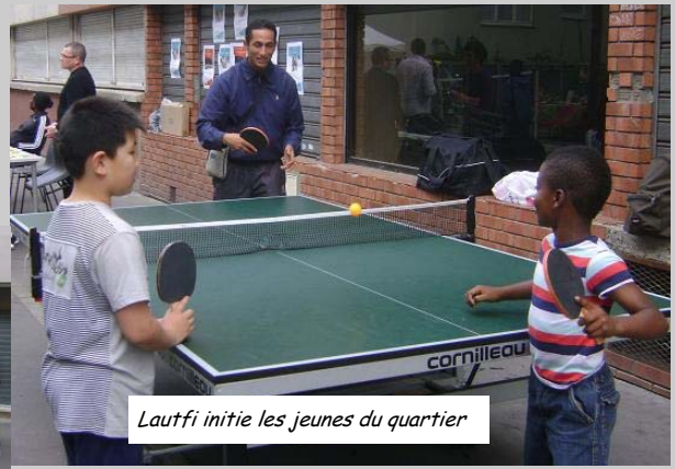
Lautfi initie les jeunes du quartier