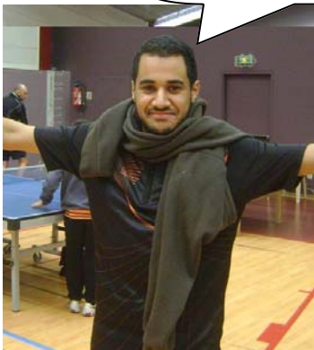
Redah est un touriste et il tient à ce que ça se sache

Eh, j'ai toutes mes affaires aujourd'hui, c'est fort non?