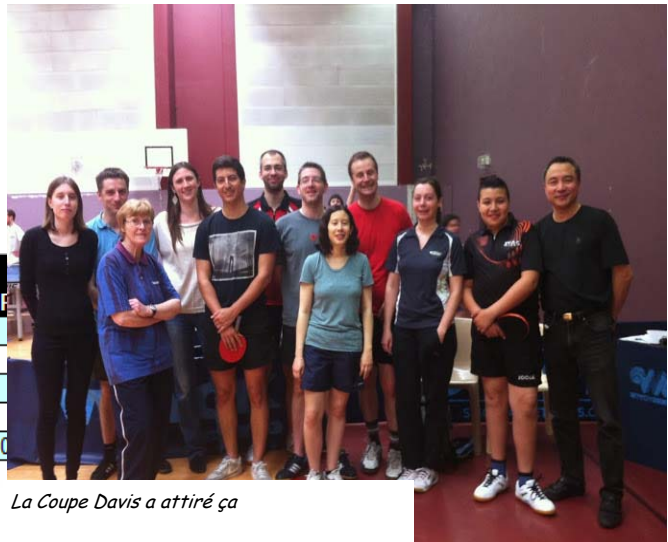
La Coupe Davis a attiré ça