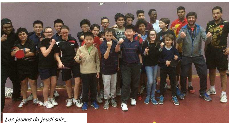
Les jeunes du jeudi soir...

« Je n'ai rien d'autre à offrir que du sang, de la peine, des larmes et de la