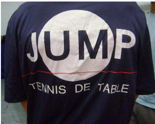
Le nouveau maillot officiel. Tout autre maillot notamment ceux « JUMP 15 Jazz Band » ne sont que ceux d'affreux usurpateurs...