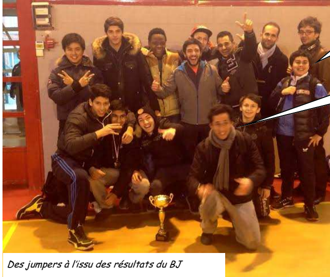
Des jumpers à l'issu des résultats du BJ

Tout le microcosme pongistique parisien était présent le 1er WE de février à Carpentier et à Le vau pour l'évènement parisien jeune de l'année : Le Bernard Jeu départemental. Pour ceux qui ont toujours pas écouté l'année précédente, c'est la compet qui oppose les clubs parisiens, chacun présentant des joueurs et joueuses dans chaque catégorie : poussin F/G, benjamin(ines),