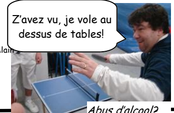
Z'avez vu, je vole au dessus de tables!