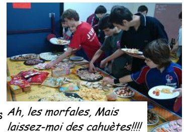
Ah, les morfales, Mais laissez-moi des cahuètes!!!!

Ce tournoi était l'occasion aussi de discuter, s'amuser, faire ripaille (« Tavernier faites-moi rôti ces poulardes!!! »). A 12h30 allez hop, on y va, en route pour l'aventure, on y résiste pas, à l'appel du buffet! Et là y avait pas que des trucs Qué s'appellerio Quetzacoatl!