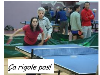
Ça rigole pas!

machin, futur bidule). Grâce notamment à sa capacité a remettre tout et à faire de bonnes claques diagonales. Quant à la coupe Davis, pour la première fois