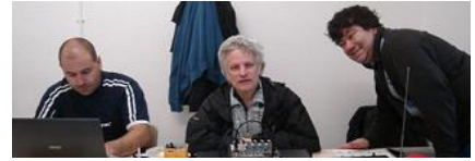
Ceux qui bossent et ceux qui font semblant...