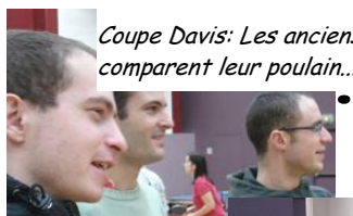
Coupe Davis: Les anciens comparent leur poulain...