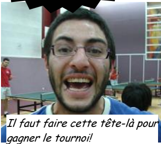
Il faut faire cette tête-là pour gagner le tournoi

Après Van Damme, Nietzsche au prochain numéro! (c'est quoi un Nietzsche?)