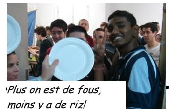
'Plus on est de fous, moins y a de riz!

expérimentée, ce fut un gros succès. L'occasion de faire jouer des gens pas habitués à jouer ensemble (la somme