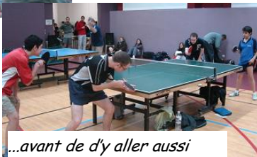
...avant de d'y aller aussi