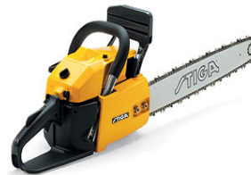
La tronçonneuse STIGA de La DEFAITE* (Bucheron, sois pas deg...)

Va-t-on continuer sur cette lancée? La DEFAITE* va-t-elle faire ses basses œuvres en phase 2? Ses potes du club des 4 cavaliers de l'Apongalyse (donc la DEFAITE, la BLESSURE DU GENOU, la SOIREE D'ANNIVERSAIRE et le KITE-SURF AU BRESIL**) ayant été très sollicités ces derniers temps, ils ont décidé de faire une pause pastis / belotte. Mais vont-ils revenir plus tôt que prévu****?