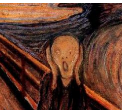
La détresse de Michel pour trouver des joueurs à la JUMP 4. Ne saute pas Michel!