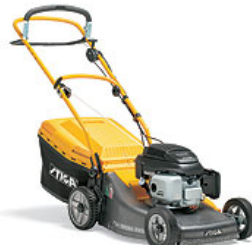
Instrument préféré de BLESSURE AU GENOU