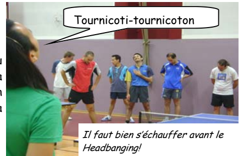
Il faut bien s'échauffer avant le Headbanging!

par une pratique du sport en remuant la tête en rythme afin de faire bouger sa